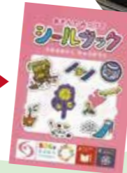
MUDで作成した 中央区のシールブック▶

MUDで作ってるんです。だけど、それを知らせるのは難しい。市の担当者には見え方のシミュレートを掲載したレポートを提出して「(見えにくい人への)配慮をしています」ということを知らせている。また、他の制作物には小さく「MUDの視点を取り入れています」と入れたりもしている。相模女子大の学生ボランティアが作った大船渡市へ寄贈する紙芝居の支援を依頼された時には「MUDで・デザイン」することを条件で引き受けた。MUDのレクチャー後、学生はスマホで色のシミュレーターを活用して全データを見事に完成させた。まだほとんど知られていないけど、こういった活動を積み重ねていくしかないんですよ。