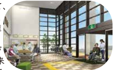
▲星が丘公民館ロビー

エコ駐車場になって、雨の日のぬかるみや、芝生の手入れなど、維持管理の手間は増えますが、そこからUDが根付いていく地域・未来の姿が見えてきそうです。