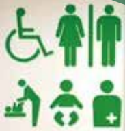
▲星が丘公民館の多目的トイレ