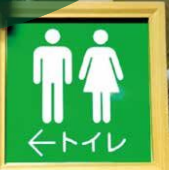
▲ソレイユさがみのトイレ