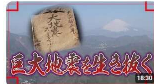
巨大地震を生き抜く～数えぶしが伝える神奈川県西部の関東大震災～ 7.3万回視聴・2か月前