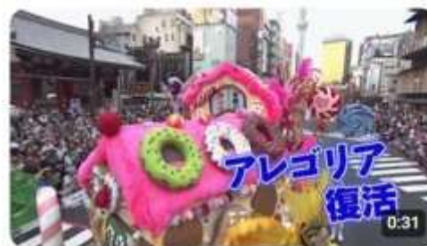
【生中継のお知らせ】浅草サンバカーニバルが完全復活！本場リオのカーニバルさながら... 9.7万回視聴・2か月前